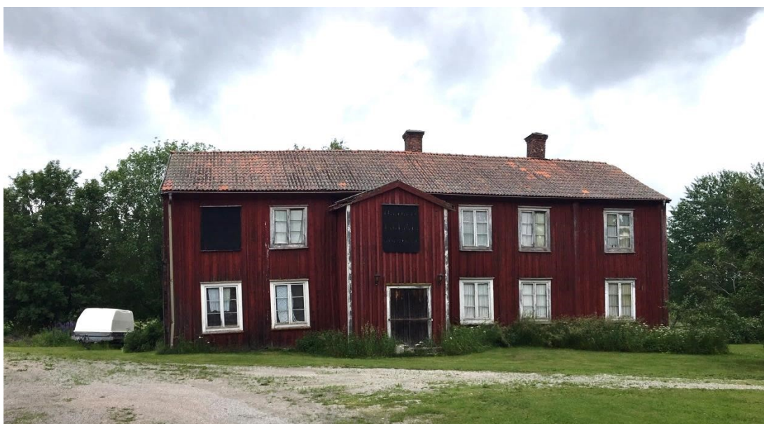
Äldre mangårdsbyggnad i Maj, Njurunda

Kommuner har möjlighet att skydda värdefulla kulturmiljöer genom skydd i detaljplan eller i områdesbestämmelser. Kulturmiljö är ett av fem allmänna intressen som ska beaktas (Kap 2 §§3 och 6)