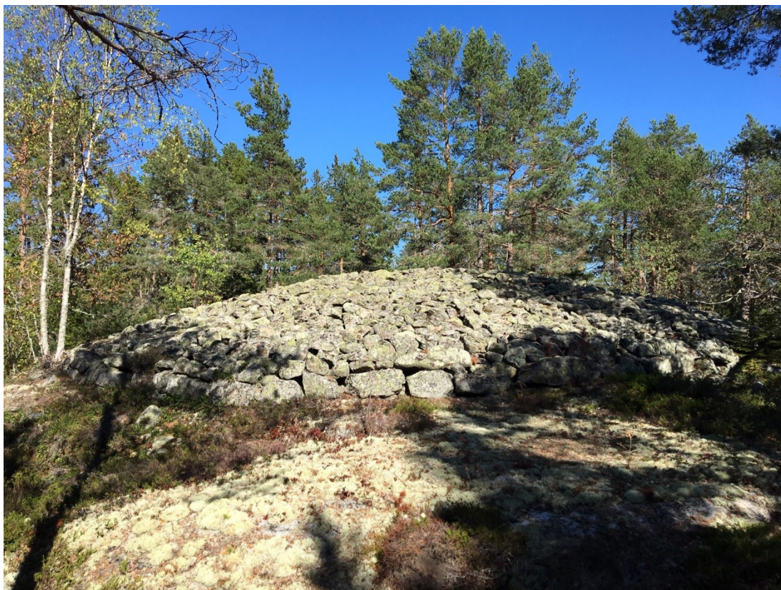
Gravröse Alnö vid Älva 12:1

Pollenanalyser som gjorts i Njurundatrakten i samband med nya E4-bygget visar att jordbruket etablerats så tidigt som på äldre bronsålder (1700-1100 f. Kr). Under århundradena kring år noll inträffade den agrara revolutionen i Sundsvallstrakten och efter redan 300 år kan vi se spår av "stormannagårdar". Detta visar att en social gruppering vuxit fram som förmodligen kontrollerade handeln över större områden och som även kom i kontakt med det romerska riket. Det jordbrukslandskap med bebyggelsestruktur som skapades under denna tid är grunden till stora delar av det odlade och bebyggda landskap som vi ser idag.