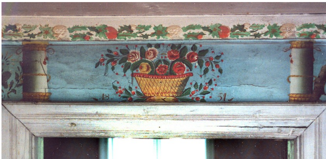
Interiör Medelpadsgård i Käfsta Indal, Källmans.

Det äldre odlingslandskapet karaktäriseras av mindre åkerlappar, tydliga diken, synliga åkerholmar och odlingsrösen i anslutning till markerna. Äldre vägsträckningar finns ofta i anslutning, liksom spår av timrade lador och stenmurar. Gamla plogskär indikerar att marken användes för odling och gärdesgårdar eller grindar visar på att man nyttjat den för bete. Diken fungerade både som dränering och som gränsmarkeringar.