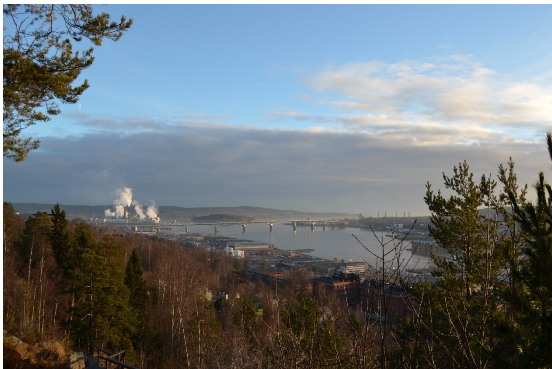
Bild över Sundsvallsbron

Sundsvalls kulturlandskap visar miljöer som berättar om järnålderns kultur, landsbygdens sockencentrum, kustlandets fornlämningar och fiskelägen, samt Industrisamhällets stads- och bostadsmiljöer. Osynliga och ännu dolda ligger även de samiska och romska miljöerna. Valfärdssamhällets kulturmiljöer och modernismens bebyggelseområden är också viktiga för kommunens identitet.