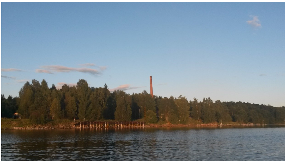
Skorsten vid Hovid sågverksområde, Viktiga landmärken utmed Sundsvalls gamla industrikust.