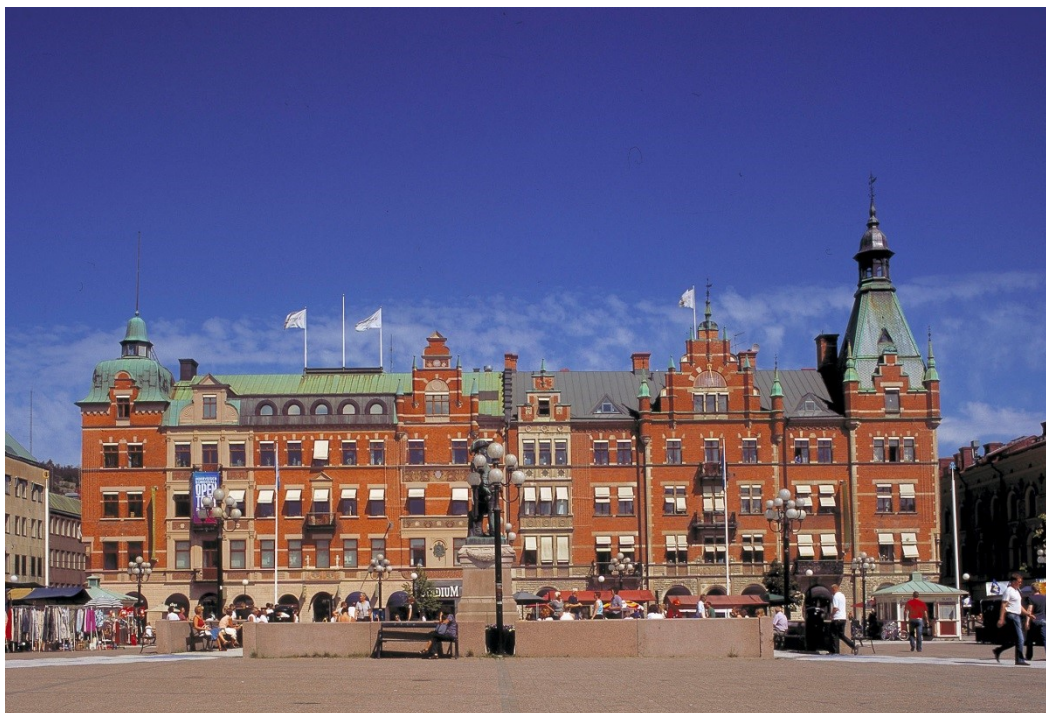
Granska huset i kvarteret Hälsan