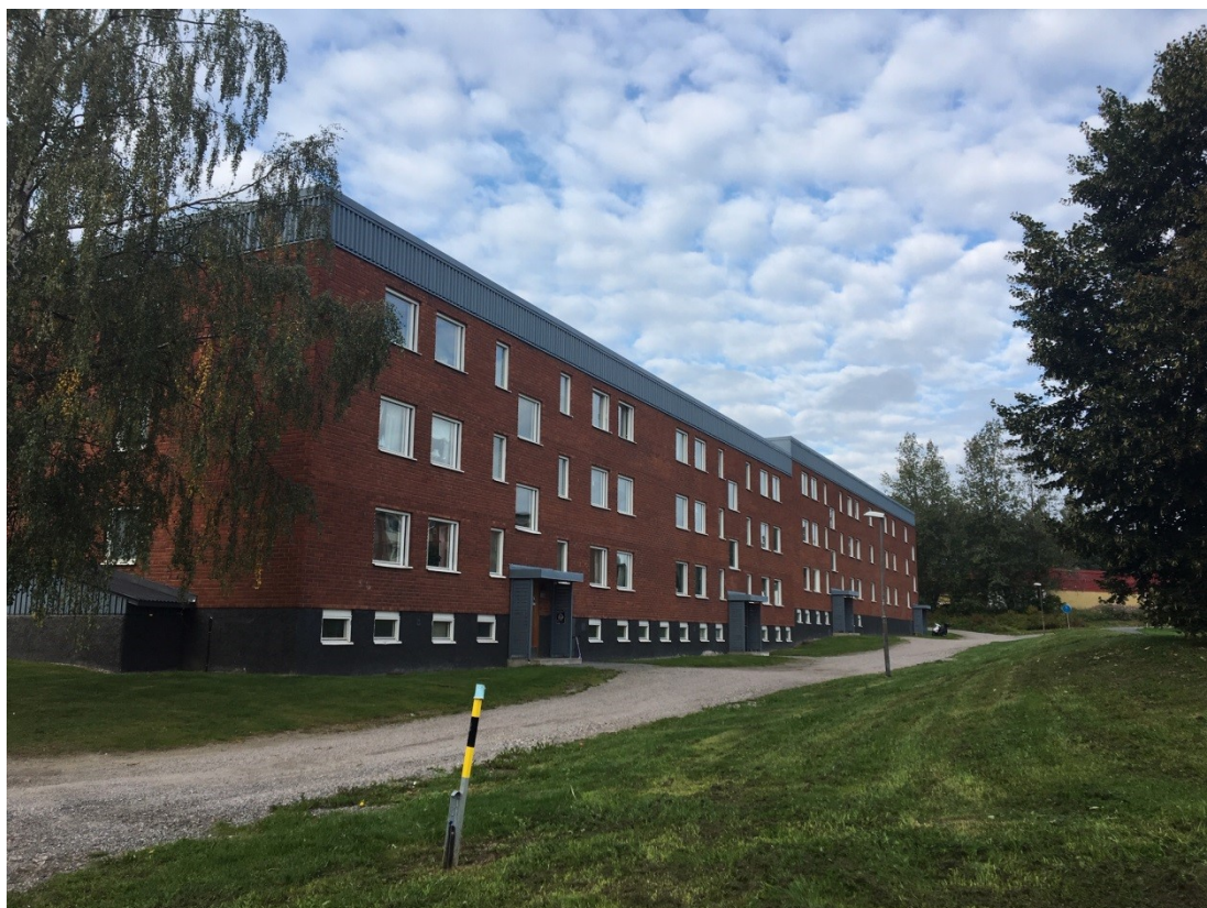
Sundsbruk Hammarvägen. 1960-tal

"Kulturmiljön är en källa till kunskap, bildning och upplevelser som bidrar till att skapa en känsla av hemvist, delaktighet och en förståelse för vår plats i tiden. Genom utforskandet av det förflutna tränas förmågan att förstå andra perspektiv och andra sätt att leva, vilket kan väcka engagemang för närmiljön och nyfikenhet vid mötet med andra människor. Däri ligger kulturmiljöarbetets potential att bidra till ett inkluderande samhälle i harmoni med miljön" RAÄ AGENDA 2030