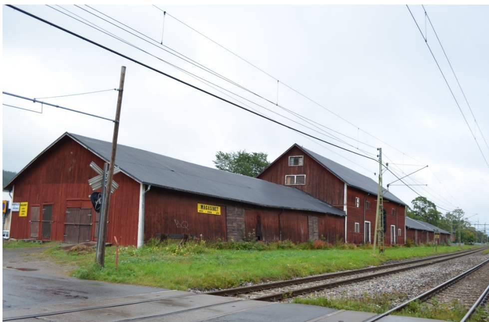
Magasinslokaler vid västra station.