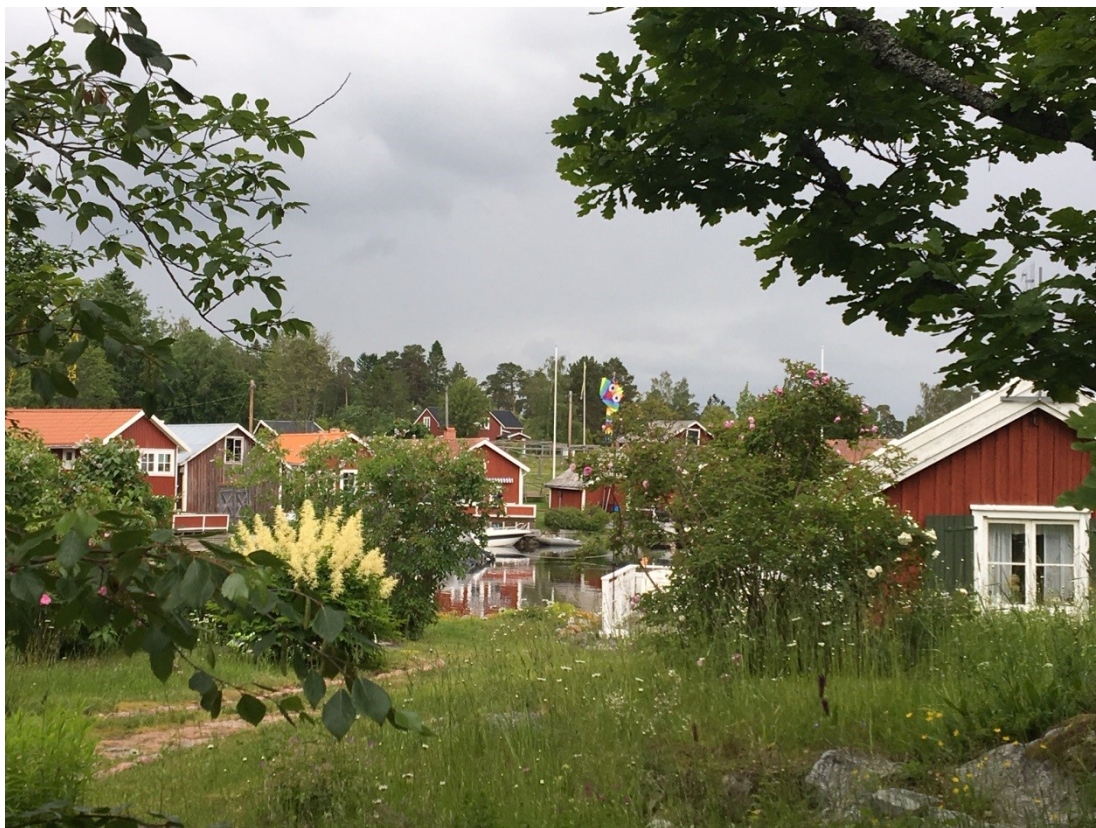
Spikarnas fiskeläge, Alnön