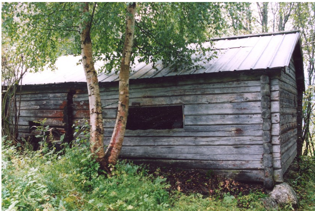
Äldre ekonomibygnad Indal Foto Hampus Benckert.

De äldsta byarna som idag finns bevarade har många gånger sina rötter i sen järnålder eller tidig medeltid. Det finns fler ortnamnsformer som visar på tidig etablering, bland annat hem-namn som i t.ex. Vattjom och Högom och Ånger-namn som i Selånger. Dessa namn har sannolikt bildats under äldre järnålder. Sta-namnen som Klingsta, Vivsta, Birsta, Korsta och Ljusta har sannolikt bildats både under äldre och yngre järnålder. (äldre järnålder 500 f. Kr - 550 e. Kr; yngre järnålder 550-1050 e. Kr ). Bystrukturerna utvecklades under medeltiden till tät bebyggelse kring en gemensam väggkorsning (klungby) eller utefter en bygata (radby) med gårdarna tätt samman. Det gamla jordbrukssamhället var indelat i byar med beslutandeorgan som byalag med en representant från varje självägande gård. Byalaget hade sedan en representant i sockenstämman där prästen var ordförande. Ansvar för att beakta bevarande av jordbruksmark åligger kommunen.