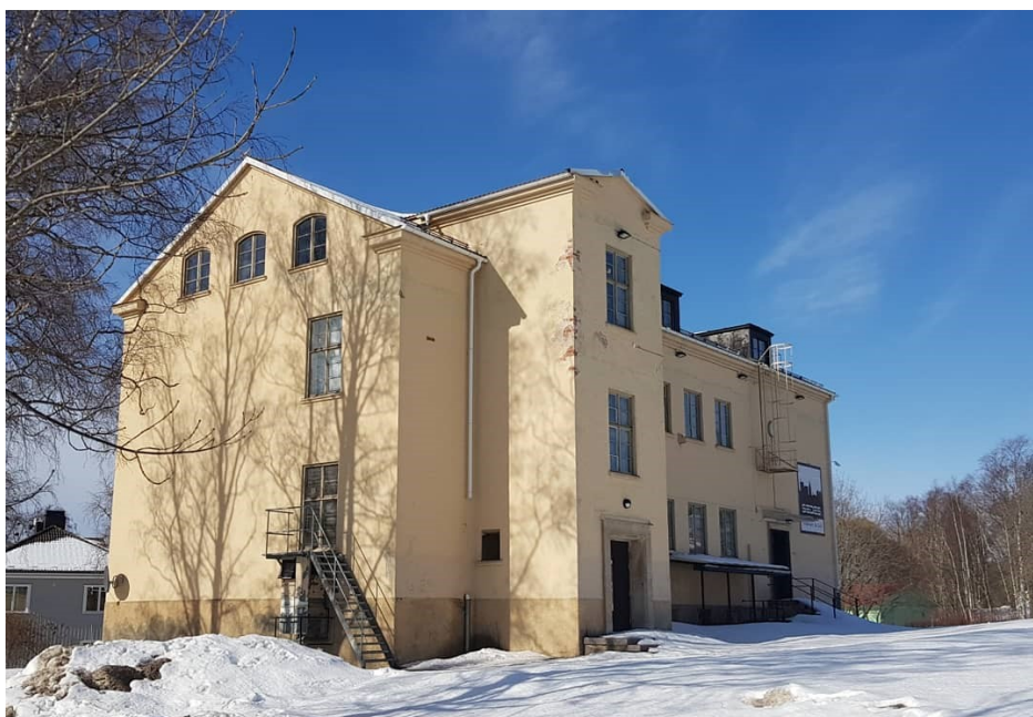
Öde skola Alnö Vi. Arkitekt Per Österlund 1934

Synen på kulturmiljön förändras över tid. Vi påverkas av vår tids normer, värderingar och den majoritetskultur som råder. Därför är det viktigt att ställa sig frågorna; Vems historia bevarar vi och varför? Vad saknas för att det ska vara en rättvis bild av vårt samhälle där alla får plats och synas?