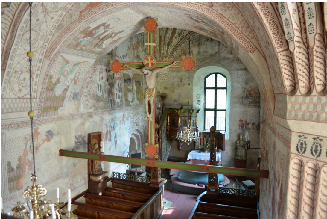
Alnö Gamla kyrka

bebyggelseområde med ett synnerligen högt värde kan förklaras som byggnadsminne av länsstyrelsen enligt Lagen om kulturminnen 3 kap (1988:950). Var och en kan väcka frågan om en byggnadsminnesförklaring genom ansökan till länsstyrelsen. Alla kyrkobyggnader som är uppförda och kyrkotomter som har tillkommit före utgången av år 1939 är skyddade enligt lagen om kyrkliga kulturminnen KML kap 4 . Även kyrkobyggnader uppförda efter 1939 omfattas av ett visst skydd genom tillståndsprövning om de anses ha ett högt kulturhistoriskt värde.