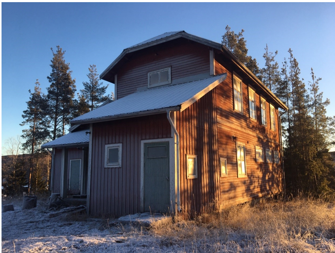
Gerdaborg IOGT-Nto Loge