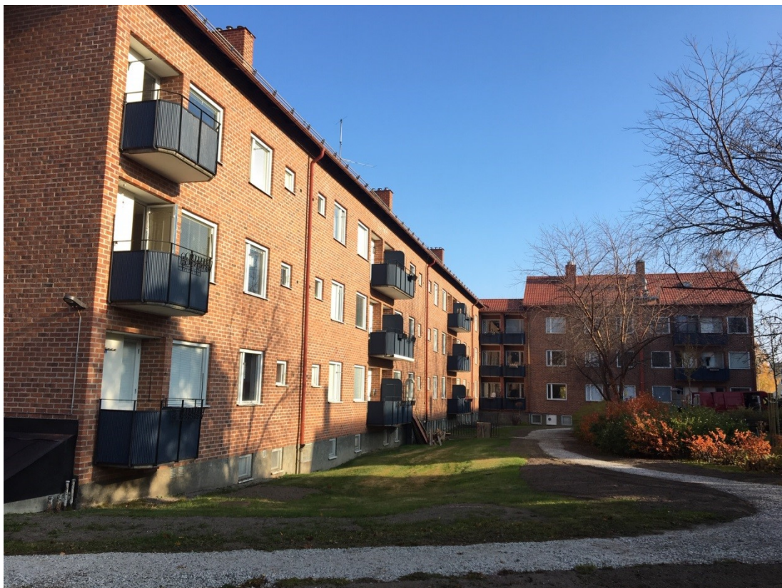
Bingen 6 Sundsvall Flerbostadshus 1952