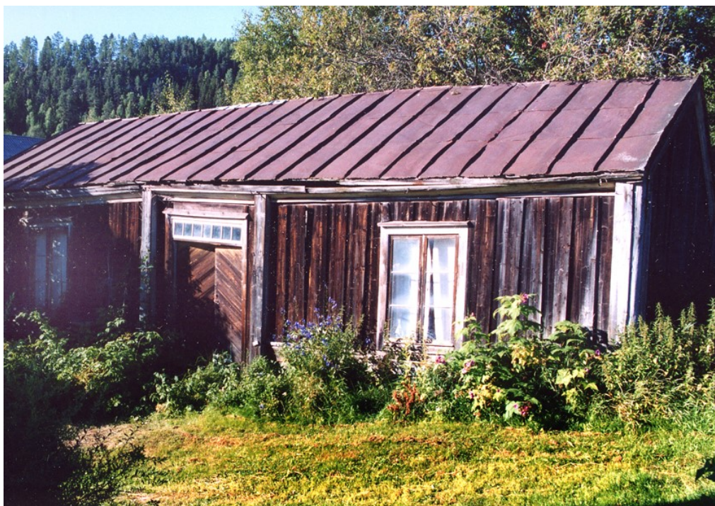
Parstuga Jordbruksbygd och odlingslandskap.

Medelpad präglas av älvdalarnas jordbruksbygder. Att uppodla mark och sedan bruka den kontinuerligt har man gjort sedan tiden för vår tideräknings början i Medelpads kustland och nedre älvdalar. Jordbruksbygder fanns då sedan årtusenden i den södra delen av Skandinaviska halvön. Sporadisk odling har skett tidigare efter Norrlandskusten men det var för ca två tusen år sedan som människorna i vårt område valde att bli bofasta, ställa sina djur och ha gödslade