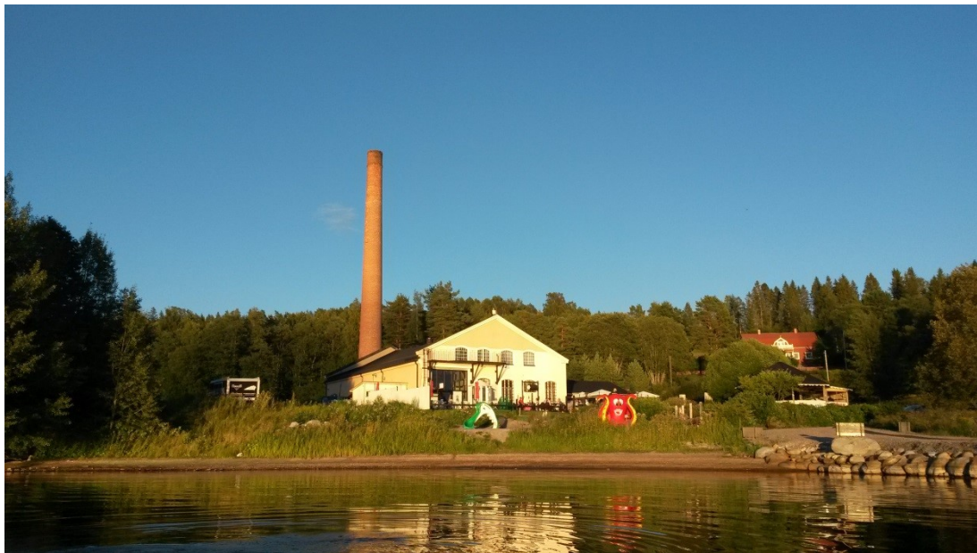
Piren, Karlsviks sågverksområde på Alnön.

Precis som sågverkssamhällena är industrilandskapen betydande för Sundsvalls identitet. De utgörs av områden med både aktiva och övergivna industrier. I Sundsvallsområdet stod den svenska skogsindustrins vagg. Införandet av ångkraft för drift av sågverk drog igång industrialiseringen av hela Sverige och i Sundsvall skapades en av världens största koncentrationer av ångsågar.