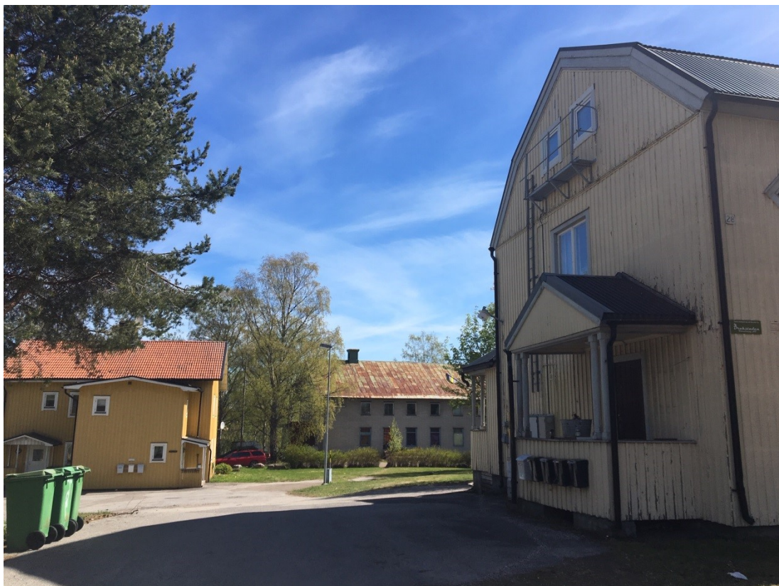
Vapelnäs F.d. Arbetarbostad ,fotograf och Sjömanskapell.

Kring sågverken växte komplementsamhällen fram under 1800-talets slut och kunde komplettera den gamla bruksmiljöns behov. Affärsgator, äldre affärsbebyggelse, äldre mackar, vägskyltar och affärsskyltar, folkets hus och biografen samt äldre kaféer är exempel på bebyggelse av högt värde i dessa miljöer.